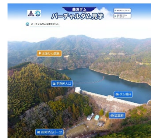
特設サイト メインビジュアル

給水開始から100年を迎えた曲澁ダムのバーチャルダム見学を、ぜひ体験してください!