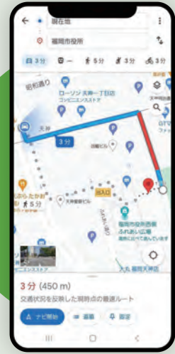
避難所へのルート案内