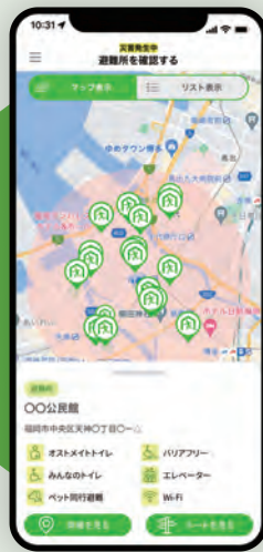
各避難所の設備の表示