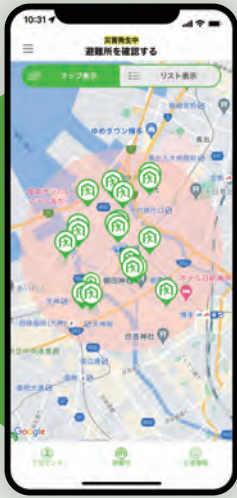
近くの避難所を表示