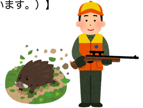
南片江校区 自治協議会・防災協会