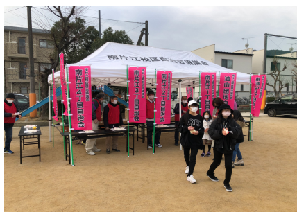
各町内会長よりお餅が配られました。

1月9日(日)、しめ縄やお正月飾り等を燃やし、今年一年の無病息災を願う校区の恒例行事『どんと焼き』が開催されました。新年のご挨拶が行き交う中、中学校野球部による校歌斉唱をはじめ同時開催の水消火器による消火訓練や、小児がん支援チャリティー『レモネードスタンド』も好評でした。また、消火後の後片付けも子どもたちの活躍を含め、多くの方に参加いただきスムーズに終了しました。ご協力・ご参加ありがとうございます。