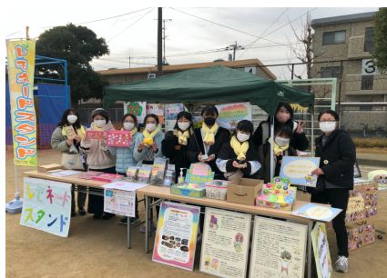
レモネードスタンドも好評でした。