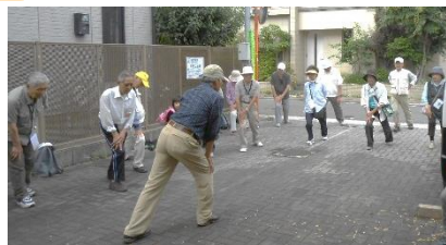
さあ、準備体操！(写真は2019,0616)