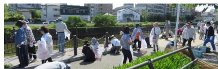
2019年のラブアースクリーンアップ

毎年5月か6月に、ハミングロード周辺でラブアースクリーンアップ鳥飼を実施しています。ラブアースクリーンアップは、1992年5月に福岡市で開催された国際会議をきっかけに、市民・企業・行政が力を合わせて始めた地域環境美化活動です。今では全国各地で開催されています。今年は新型コロナウイルス対策で 6月20日のラブアースは中止します。