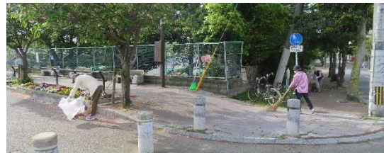
落ちた花びらや落ち葉を掃いて路上をキレイにします

第1土曜日：1・4丁目、第2土曜日：5丁目 第3土曜日：6丁目、第4土曜日：7丁目