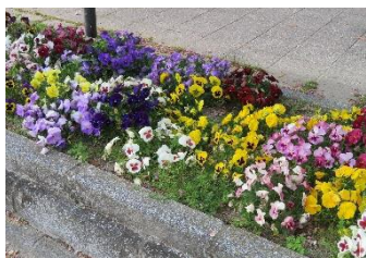
ハミングロードの花壇に咲く花

鳥飼校区にはハミングロードや各公園など、様々な場所に花壇が整備されています。この花壇に校区にお住まいの皆さんと一緒にキレイな花を植えたいと思います。花と緑を楽しめる美しい鳥飼校区を目指しましょう。