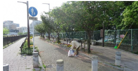
落ちた花びらや落ち葉を掃いて路上をキレイにします

第1土曜日：1・4丁目 第2土曜日：5丁目 第3土曜日：6丁目 第4土曜日：7丁目