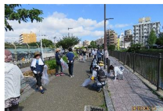
2019年のラブアースクリーンアップ