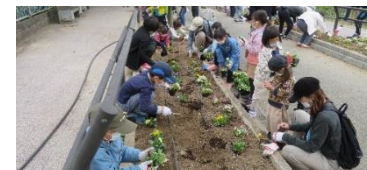
2021年11月の花植え活動

鳥飼校区にはハミングロードや各公園など、様々な場所に花壇を整備しています。この花壇に校区にお住まいの皆さんと一緒にキレイな花を植えます。花と緑が楽しめる美しい鳥飼校区を目指しましょう。