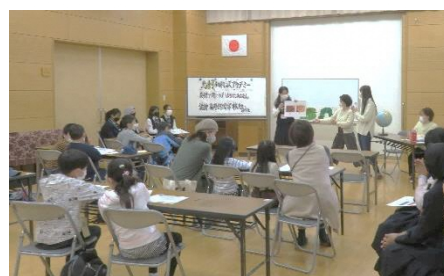
子ども達に大人気のチルドレンズアカデミー

そして、自治会・町内会だけで解決が難しい課題に対して、校区単位で連携して取り組んでいるのが自治協議会です。つまり、自治協は「自分たちの住むまちを自分たちで住みやすくしていく」ための組織であると言えます。鳥飼校区に住む多くの方が、鳥飼に住んで良かったと思えるような活動に取り組んでいますのでぜひご協力ください。