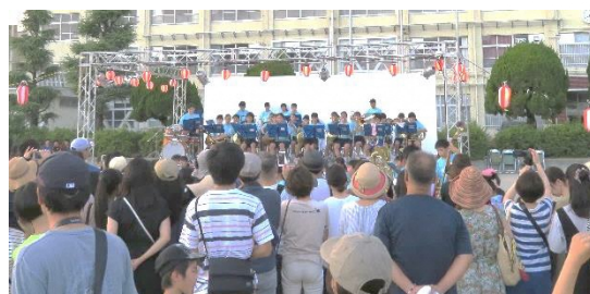
多くの人々で盛り上がるふれあい夏まつり

令和3年度は新型コロナウイルスの影響で多くの行事が中止となりました。現在も見通しは立ちませんが実施方法等を工夫しながら活動をしていきます。ぜひ気軽に参加ください。