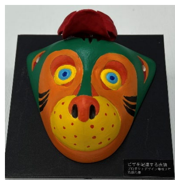
↑学生が新しくデザインした「猿面」 (今宿人形と同じ型を使用)