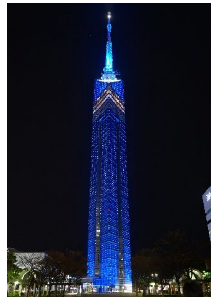
青色にライトアップした福岡タワー