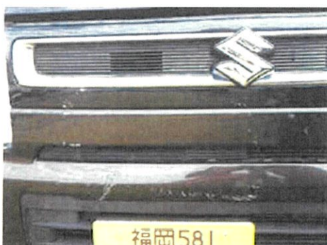
(フロントバンパー)