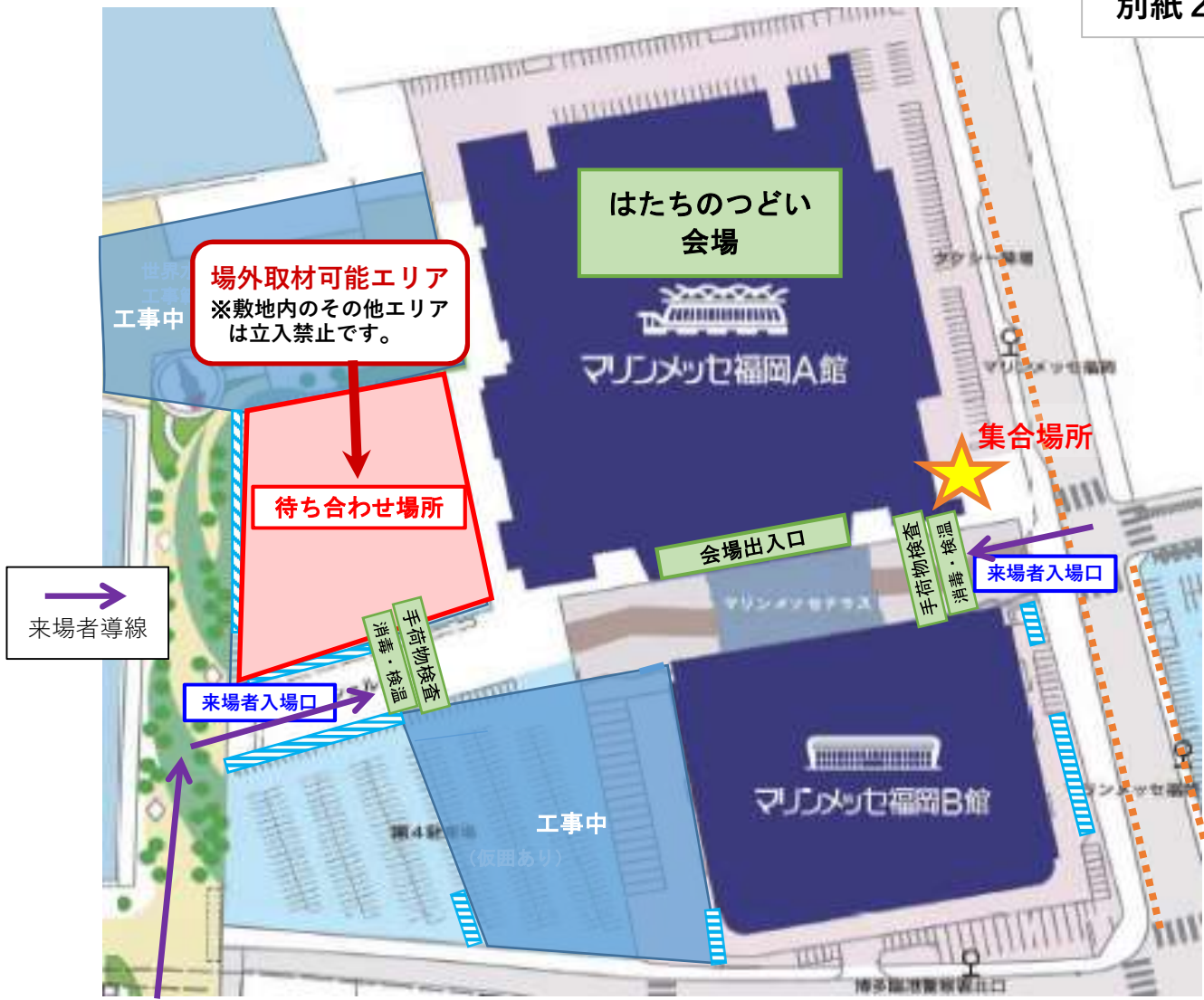
別紙2・場外平面図