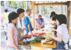
仲良く食事の準備(昨年)

1泊2日のキャンプを通じて自然体験や仲間づくりを行います。期9月13日(土)~14日(日)所今宿野外活動センター(西区今宿上ノ原)区内に住む小学5・6年生定抽選で70人料1,000円(傷害保険料含む)区地域振興課(☎833-4412 F831-2355)申はがき(〒814-0006百道二丁目2-1)かファクス、メール(t-shinko.SWO@city.fukuoka.lg.jp)に事業名、参加者全員の住所、氏名、学年、電話番号を書いて8月22日(金)(必着)までに同課へ。