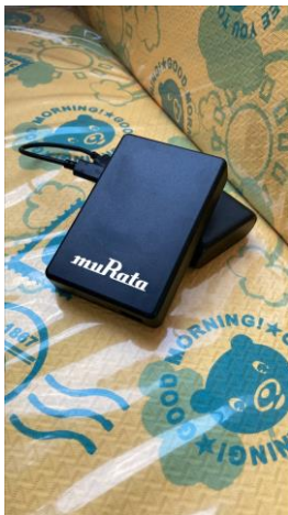
車室内モニタリングシステムで使用する Wi-Fi センサ

株式会社村田製作所（以下、当社）は、通園バスにおける幼児置き去り事故防止プロジェクトを2022年11月8日から開始し、Wi-Fi を利用した車室内モニタリングシステムの検知から通知までを福岡市の学校法人吉住学園 那珂幼稚園（以下、「那珂幼稚園」）で実証実験します。本実証実験は「福岡市実証実験フルサポート事業」に採択されました。