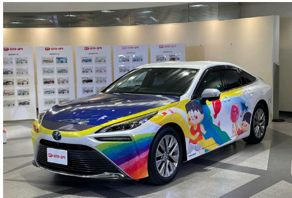
大会当日先導車となる「ミライ」