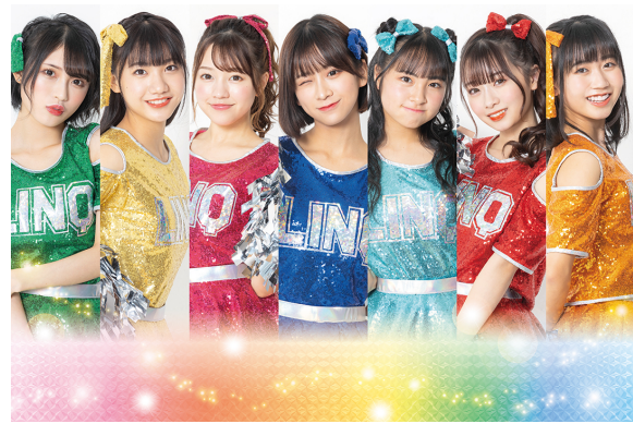
大会アンバサダー「LinQ」

※11月13日（日）マラソン当日は、フィニッシュ会場に「おもてなしエリア」を設けます。 おいしい福岡・糸島の食で、ランナーの皆様をお迎えします。(今大会はランナー専用エリアです)