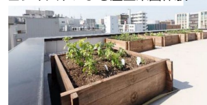
コンポストによる屋上菜園体験