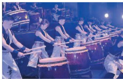
福岡大学和太鼓部「鼓舞猿」

城南警察署開庁を記念して、福岡県警察音楽隊がオープニングを飾ります。校区の子どもたちのダンスや、中村学園大学の学生のギター演奏など盛りだくさんの内容です。