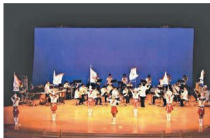
福岡県警察音楽隊