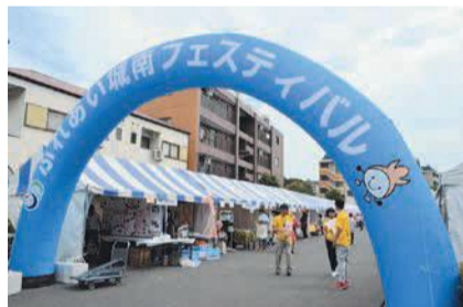
前回開催時の出店の様子