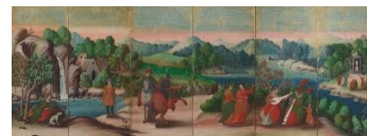
《泰西風俗図屏風》(右隻) (重要文化財) 桃山-江戸時代 17世紀

屏風は、間仕切りや風除けなど、室内装飾として欠かせない調度品でした。屏風絵ならではの画面に描かれた迫力ある表現や、折ることによって生まれる立体感をお楽しみください。