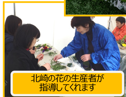
北崎の花の生産者が 指導してくれます