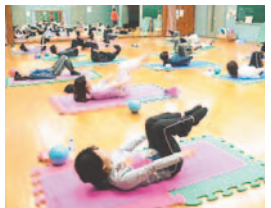
これでストレスも発散

ストレス解消! ボディケア教室 ストレッチ、リズム体操、バランスボールエクササイズ、筋力トレーニングなど。開8月23日(土)～9月6日(土)の毎週水・土曜日(全5回)午後3時～4時 市内に住むか通勤する18歳以上 定20人 料1,400円 申往復はがきに応募事項と性別を書いて7月15日～31日(必着)に同館へ。