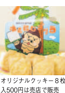
オリジナルクッキー8枚入500円は売店で販売

動物にもやさしい動物園」を目指して20年に及ぶ整備工事が行われています。工事中はベビーカーや車椅子などが通れない箇所があり、ご迷惑をお掛けしますがご了承ください。 【問合せ先】総合案内所 (☎531-1968) ☎531-1996 ホームページhttp://zoo.city.fukuoka.lg.jp/