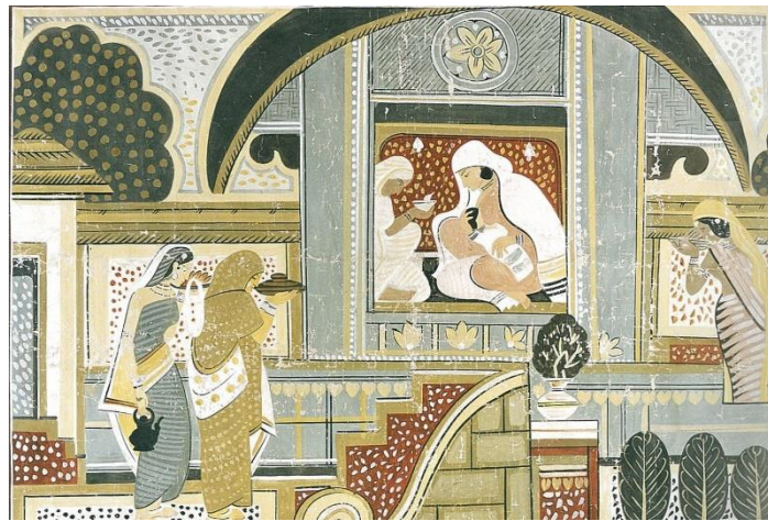
ナンダラル・ボース《チャイタニヤの誕生》1931年頃

会期中には、インド文化のイベントや音楽イベント、アジアフードマルシェなどを開催予定。さらにはカフェやショップでインドのメニューの提供や雑貨の販売もおこないます。