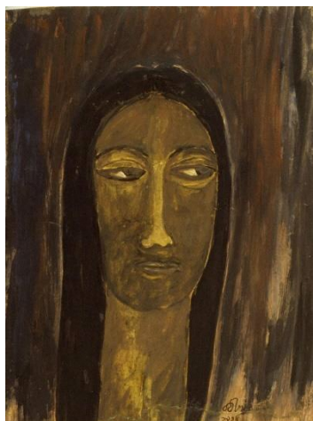
ラビンドラナート・タゴール 《女性像》1935年頃