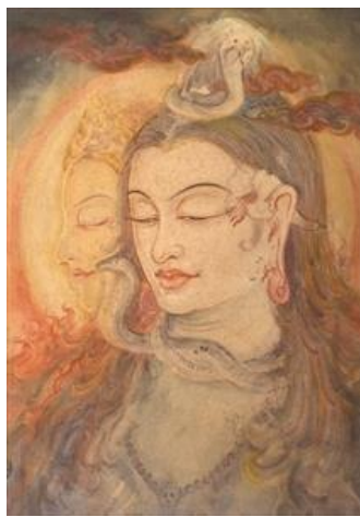
ウペンドラ・マハラティ《永遠のシヴァとパールヴァティ》1931年頃