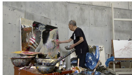
『描き続けて、100歳～画家野見山暁治～』